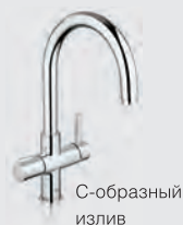
Система GROHE Red® Duo